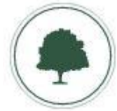
Gaststätte ZUM LINDENBAUM

Gaststätte – Catering – Speiseversorgung – E-Bike-Service Im Dorfe 15, 99438 Hetschburg, (036458) 48476, zumlindenbaum.de Öffnungszeiten: Di bis Fr, 11 bis 21 Uhr; Sa & So, 11 bis 18 Uhr